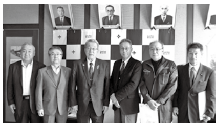
税制提言 野田村長(11月8日)

今年も4市町村長に「公平で健全な税制」の実現を目指して、税のあるべき姿や将来像を見据えて建設的な提言を行いました。また、地域ならではの課題等についても意見交換を行いました。