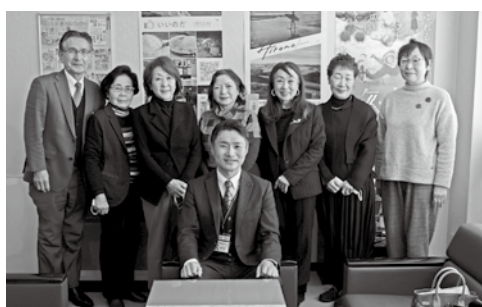
女性部会税務研修会 今年も確定申告を見学させて頂きました。 (2月16日)