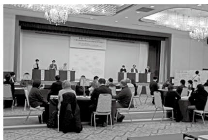
「北三陸の未来予想図」を語り合った パネルディスカッション 活発な意見交換が印象的(2月10日)