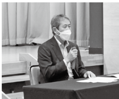
税務研修会での夏坂久慈税務署長の 講話(5月18日) 人口減少が税務行政に及ぼす影響等 についてお話頂きました