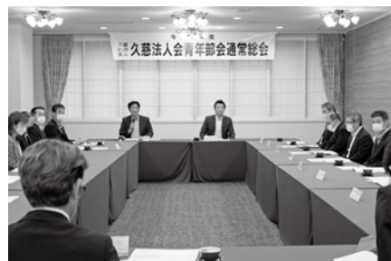
緊張感漂う第11回青年部会会員会議 (6月23日)