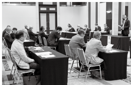
第1回定例理事会 (5月18日)