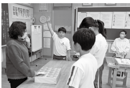
女性部による夏井小学校租税教室生徒の 皆さんは元気一杯でした！(6月13日)