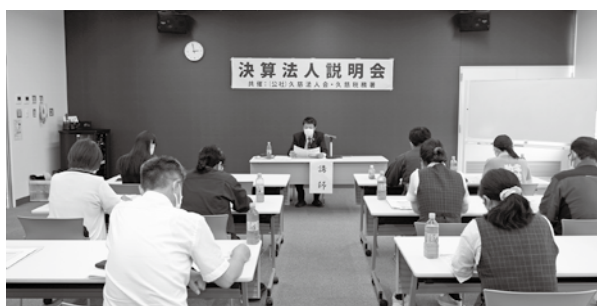
6月～11月決算法人を対象とした決算法人説明会 (6月26日)