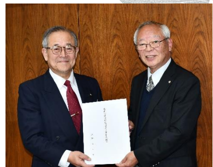
濱欠久慈市市議會議長へ税制提言書手交