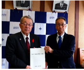
對馬会長から小田村長へ 税制提言書を手交