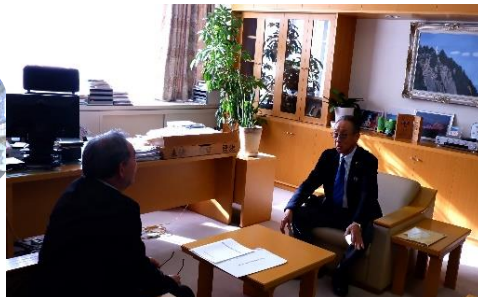
柁屋村長と地域情勢等を 情報交換を行う對馬会長