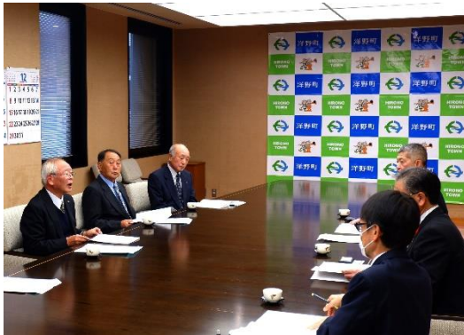
税制提言要旨を説明する晴山副会長