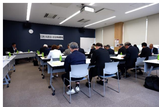
理事の皆様、お疲れさまでした。