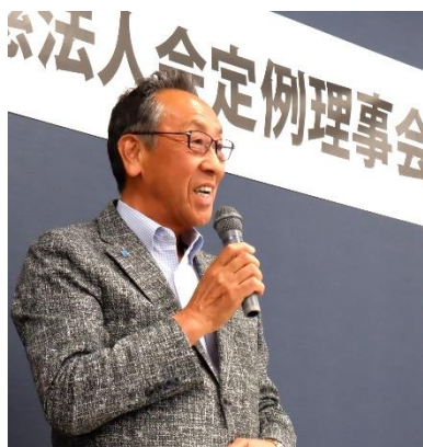
對馬会長あはさつ