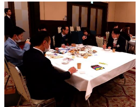
各グループとも真剣