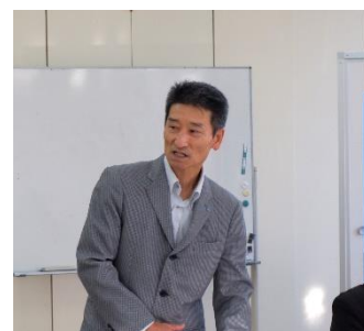
中上副会長あいさつ