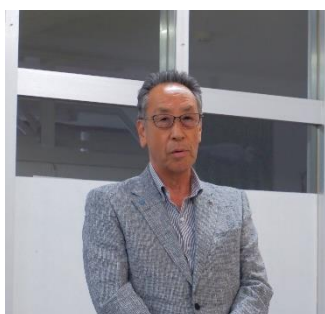
對馬会長のあいさつ