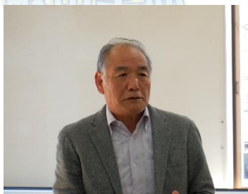
晴山支部長 あいさつ