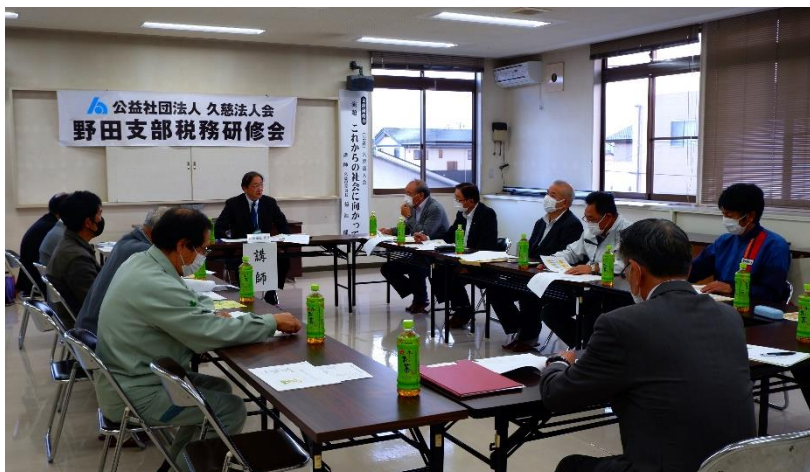
講演会の様子です。