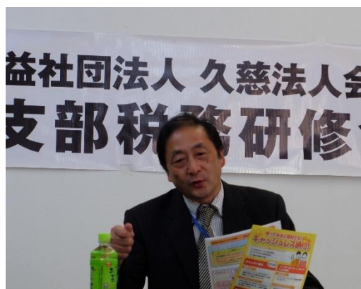
分かりやすく丁寧に説明をしていただきました