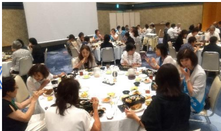
再開に喜びもひとしお お話が弾みました!