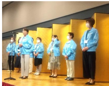
次回開催「気仙地区」 の皆さまのプレゼンテーション