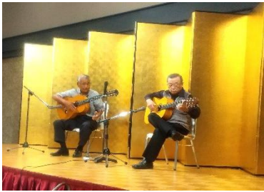
これが、フラメンコギター!