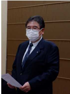
外里税理士ご挨拶