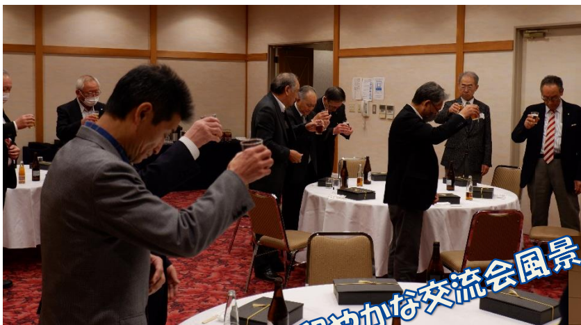
和やかな交流会風景