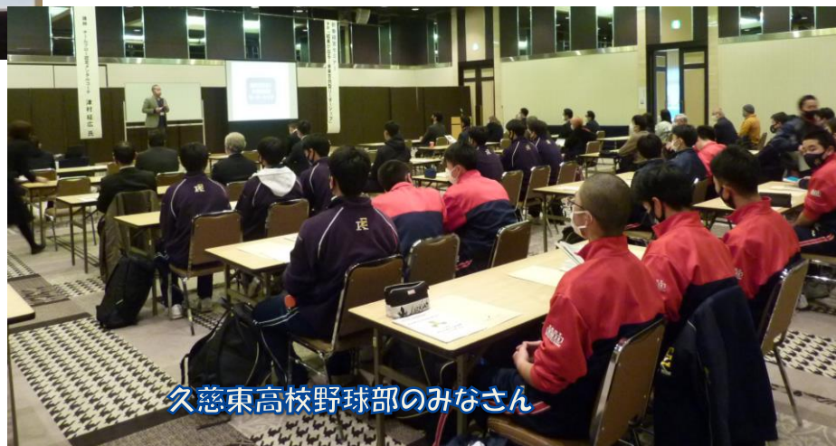
久慈東高校野球部のみなさん