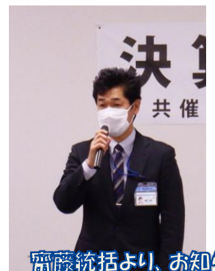
齋藤統括より、お知らせ