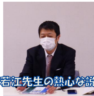
若江先生の熱心な説明