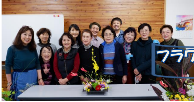
フラワーアレンジメント講習会