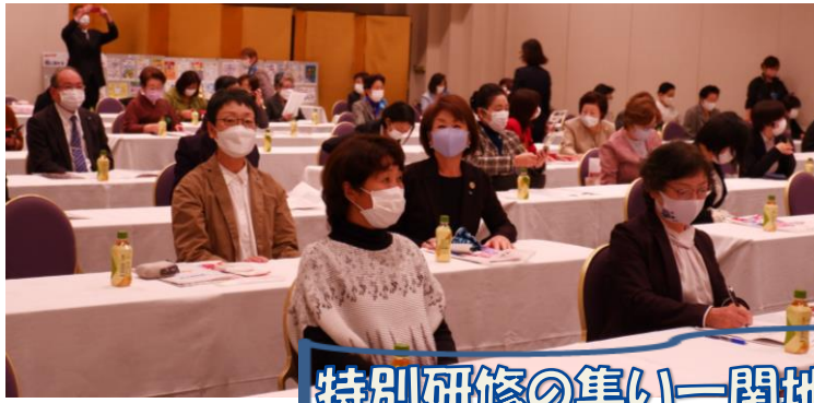
特別研修の集いー関地区大会