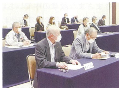
第1回定例理事会（5月14日(金)）