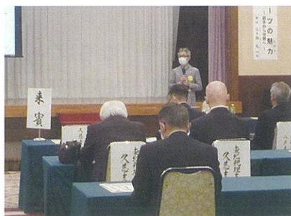
総会記念講演会（6月15日(火)）