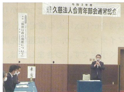
第9回青年部会会員会議（6月23日(水)）