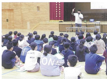
久慈小学校租税教室（5月27日(木)）