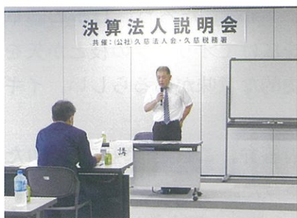
決算法人説明会（6月23日(水)）