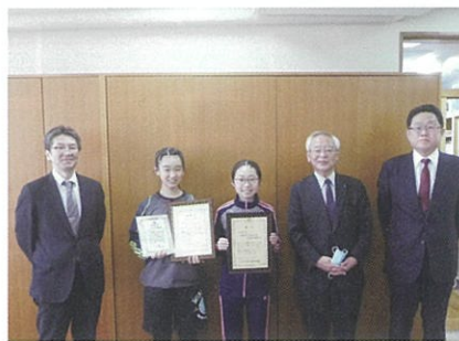
絵はがきコンクール表彰向田小（3月18日(木)）