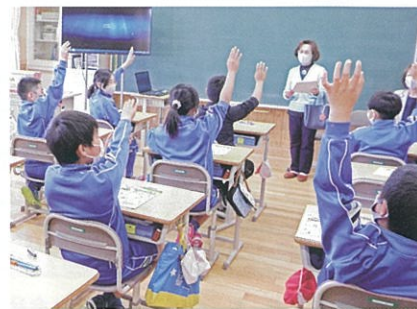
中野小学校租税教室（5月31日(月)）

法人会ホームページにリンク願います http://kujihoujinkai.com/ 久慈法人会HPの事業案内ページのメールで、社名、業種、セールスポイントを記入して返信下さい。