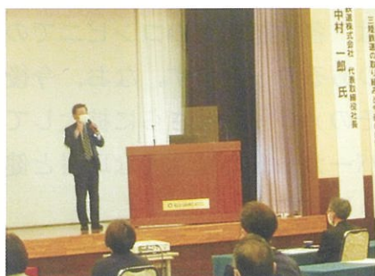
新春経営セミナー（2月18日(木)）