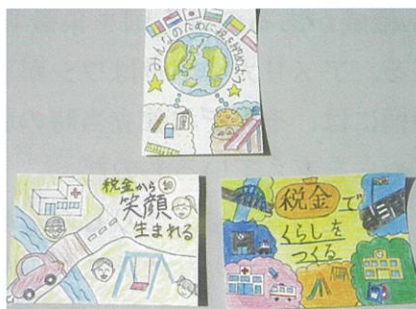
第13回絵はがきコンクール優秀作品