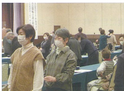
新春講演会（2月3日(水)）