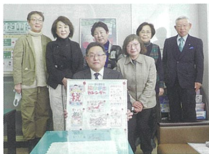
女性部会税務研修会（2月18日(木)）