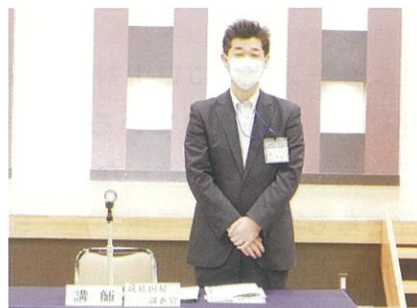
税務研修会（5月14日(金)）