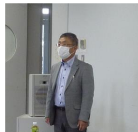
中新井田専務理事 挨拶