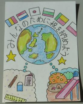
久慈法人会会長賞