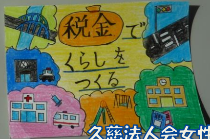
久慈法人会女性部会長賞