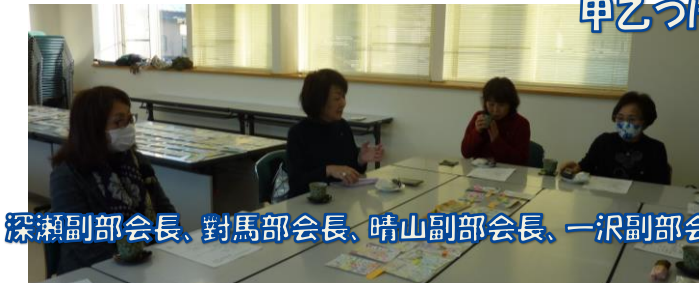
深瀬副部会長、対馬部会長、晴山副部会長、一沢副部会長