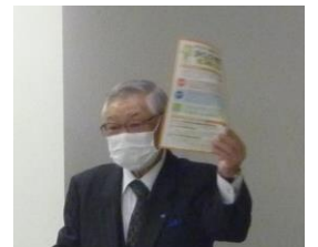
事務局より、お知らせ