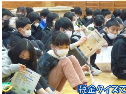
税金クイズで盛り上がりました(*・*)