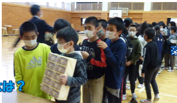
豪華賞品(・・?)獲得者!は