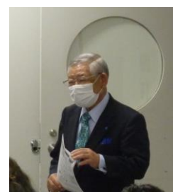
事務局からの連絡