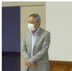
AIG 損害保険、塩崎支店長