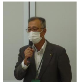
洋野町商工会 下川原事務局長挨拶