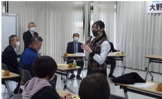
参加者の皆さんの自己紹介