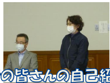
参加者の皆さんの自己紹介