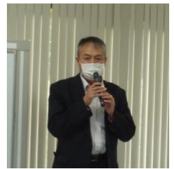
洋野町商工会大野支所 山口支所長