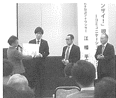
新春経営セミナー(2月6日)