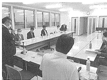
第8回会員会議(6月23日)