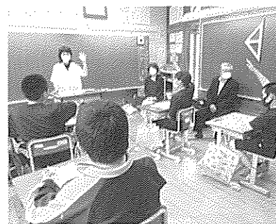
租税教室(来内小学校 7月7日)

インターネットセミナーをご利用ください http://kujihoujinkai.com/