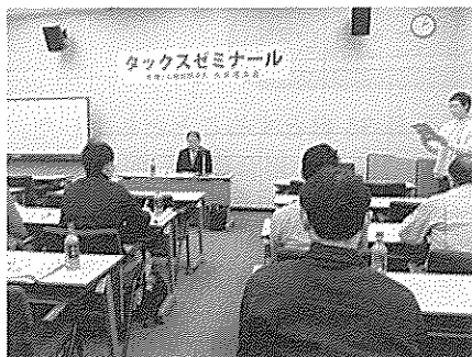
第3回タックスセミナー(1月22日)