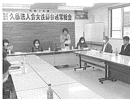
第8回会員会議(6月23日)