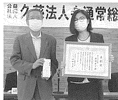
優良経理担当者表彰(6月19日)