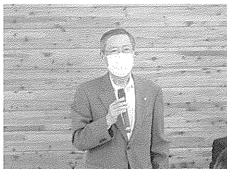
第4回定例理事会(3月11日)