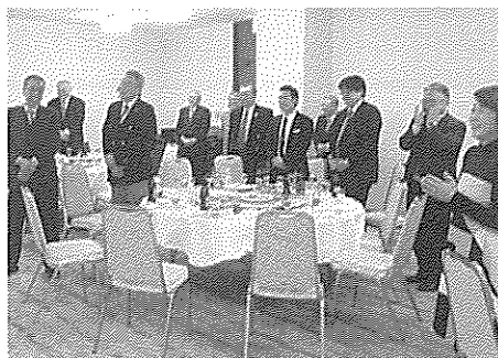
新年賀詞交換会(2月13日)