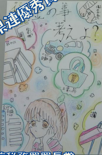
久慈税務署署長賞