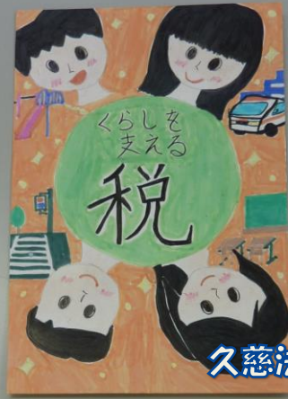
久慈法人会会長賞