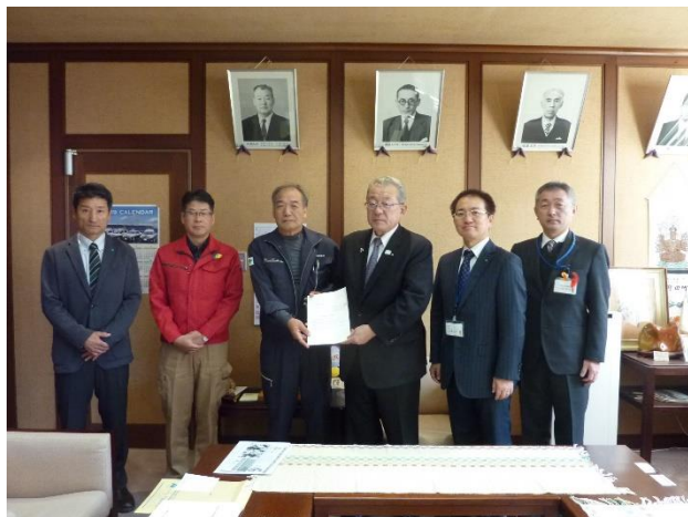
小田野田村長に晴山野田支部長から提言