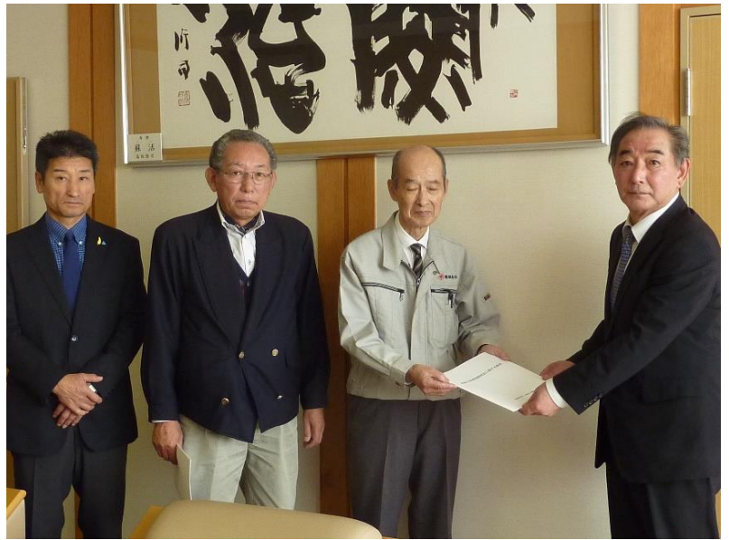
征谷普代村長に嵯峨副会長・支部長から提言