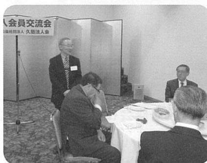
新入会員交流会（4月16日）