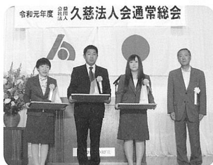
優良経理担当者表彰（6月18日）