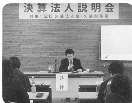
決算法人説明会（6月21日）