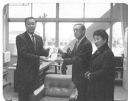
長内小学校に寄付（2月6日）