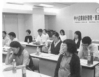
中小企業会計普及センター（7月18日）