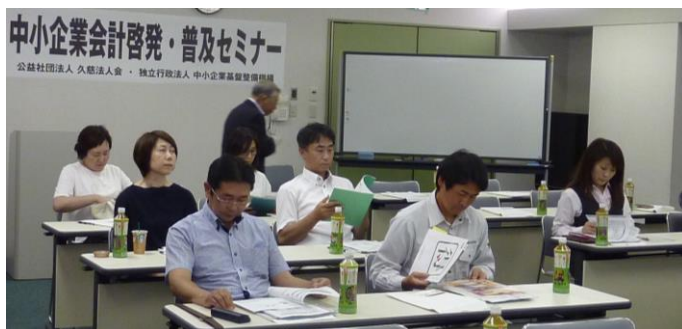
暑い中のご参加ありがとうございます。