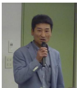
中上専務理事の挨拶