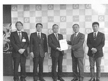
久慈広域 4 市町村長に税制改正提言