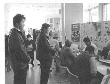
産業まつりで税金クイズ 10/12～14