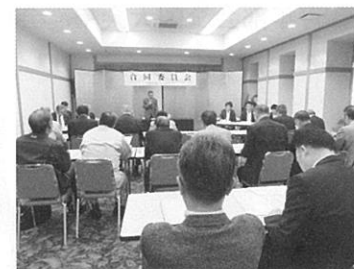
合同委員会 9 月 25 日