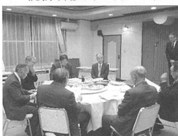
税理士との懇談会 12 月 10 日