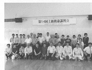
上級救命講習修了者 7 月 28 日