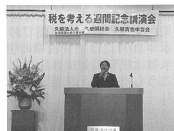
税を考える週間記念講演会 11 月 14 日