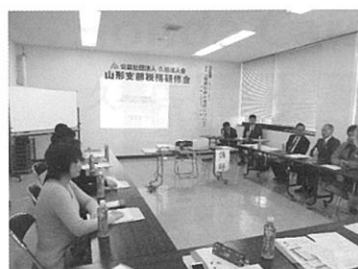
山形支部税務研修会 10 月 22 日