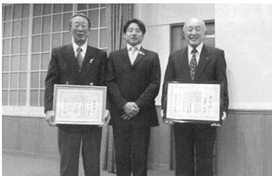
受賞の中塚理事（左）池谷講師と高屋敷理事（右）