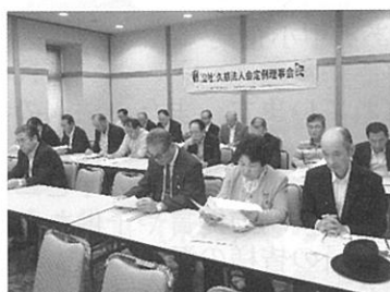
第 2 回理事会 8 月 31 日