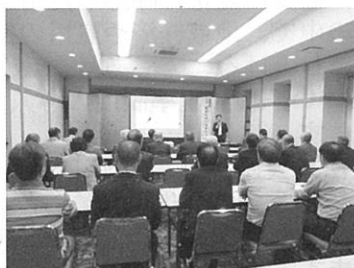
税務研修会 8 月 31 日