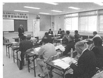
野田支部税務研修会 10 月 24 日