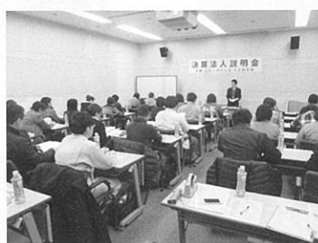
決算法人説明会 12 月 14 日