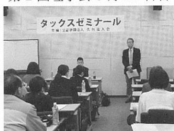
タックスゼミナール (3 回)