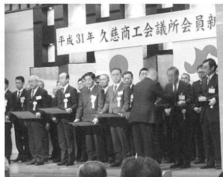
向会頭から賞状を受ける嵯峨会長