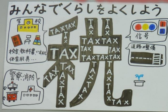
久慈法人会会長賞