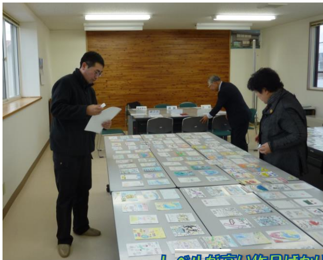
レベルが高い作品ばかり! 悩みます