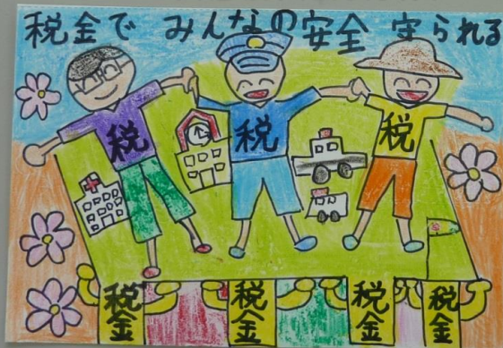
久慈法人会女性部会長賞