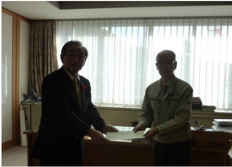
嗟峨支部長より征谷村長に提言