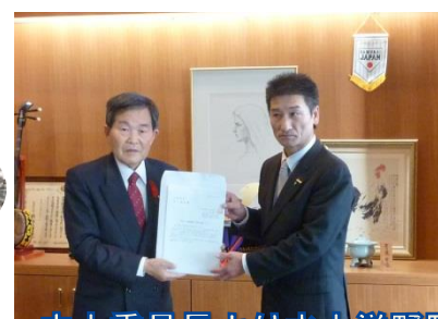
中上委員長より水上洋野町長に提言