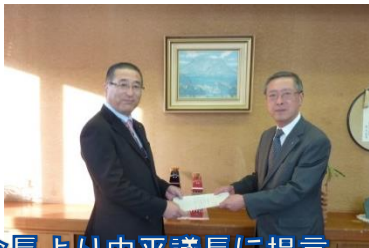
嗟峨会長より中平議長に提言