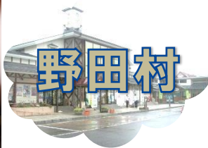
晴山野田支部長より小田野田村村長に提言