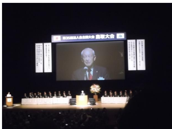
全国大会式典の様子