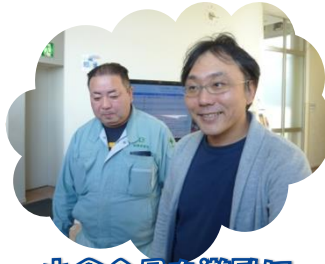
小倉会員も激励に