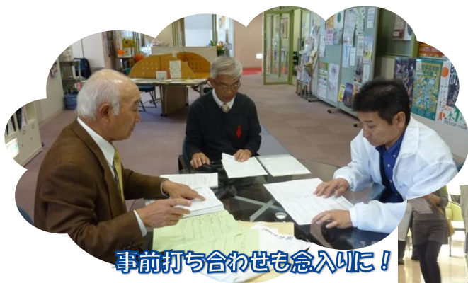
事前打ち合わせも急入りに!

参加者は 2 日間で 410 名（10 月 13 日（土）は 230 名、10 月 14 日（日）は 180 名）の方にチャレンジして頂きました。天気が良かったため例年の人数を超えました。