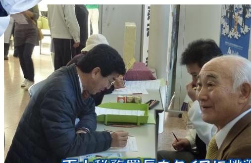
下山税務署長もクイズに挑戦!