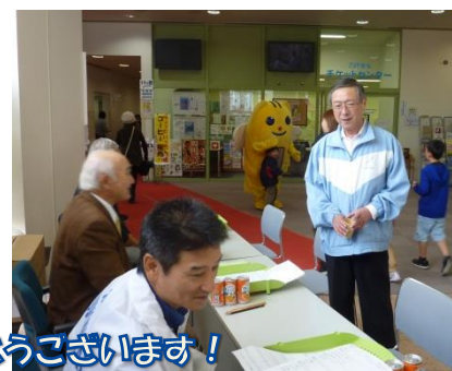
嗚嗚会長差し入れありがとうございます!