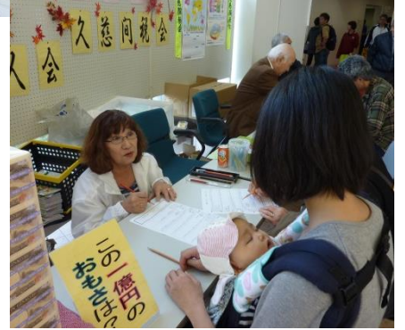
西、前事務局長もお手伝い