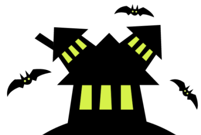
たくさんのご来場ありがとうございました！