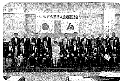
表彰者・来賓記念写真