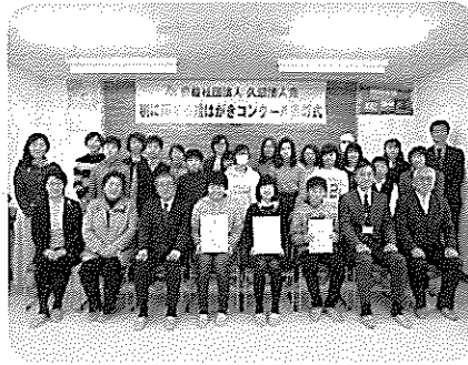
絵はがきコンクール表彰式