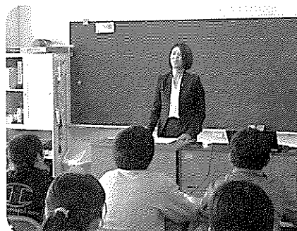
租税教室（青年部会）