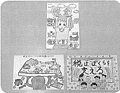
絵はがきコンクール優秀作品