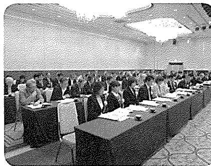
第6回通常総会の様子