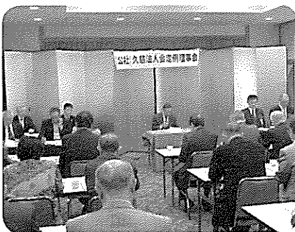
平成30年度第1回理事会