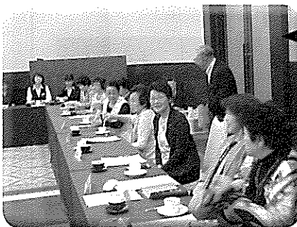
会員会議で和やかに談笑