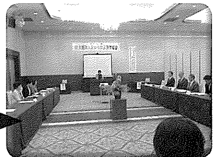
第6回女性部会会員会議