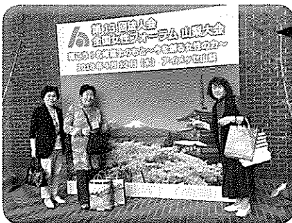
全国女性フォーラム山梨大会

全国女性フォーラム 絵はがき作品も年々増加しレベルもあがっています 久慈法人会推薦の作品も連続入賞です。