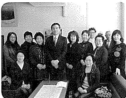
確定申告について税務研修会