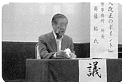
総会で議長を務める嵯峨会長