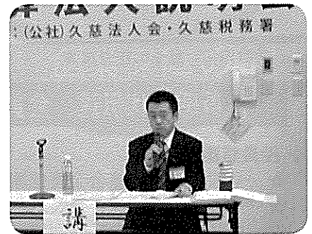
平成30年度決算法人説明会