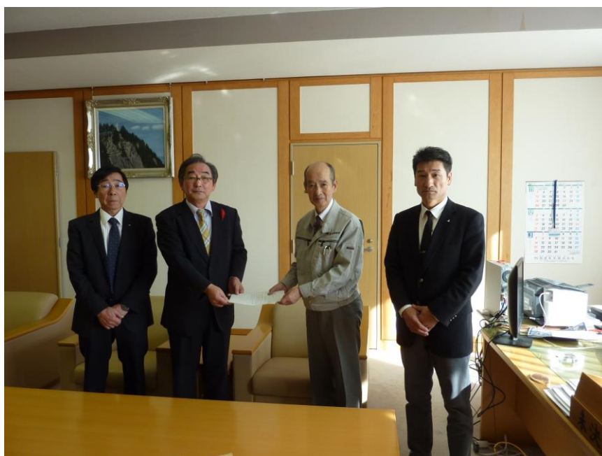
嵯峨普代支部長より柁谷村長へ提言