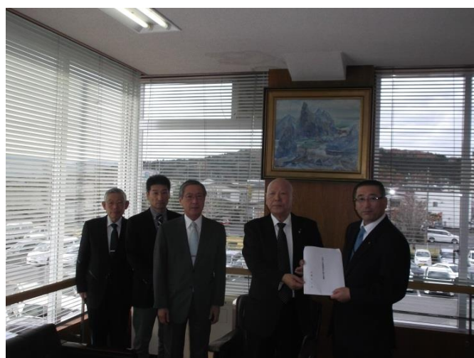
谷地会長より久慈市議会中平議長へ提言