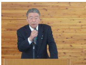
谷地会長よりご祝辞