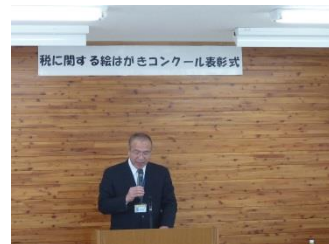
近谷税務署長よりご祝辞