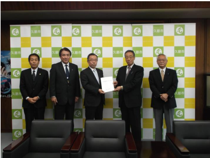
遠藤久慈市長への提言