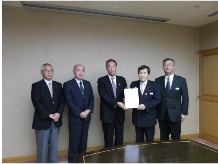
水上洋野町長への提言