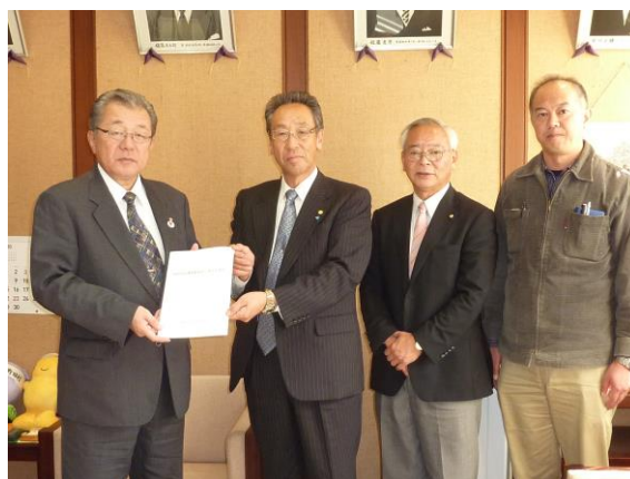
小田野田村長への提言