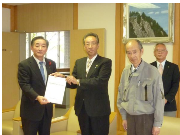
柁屋普代村長への提言